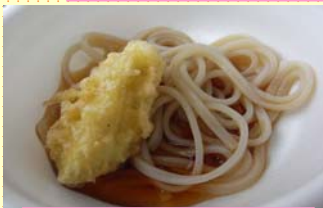
小江戸芋天うどん

今年は川越産の食材(お米・卵・黒豚・さつまいも・芋うどん・醤油・ビール)を使用したメニューをご用意しました