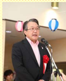
川越市議会議員 大泉一夫先生