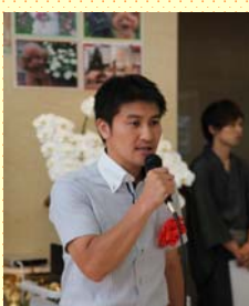
埼玉県議会議員 荒木裕介先生