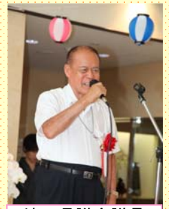
埼玉県議会議員 渋谷実先生