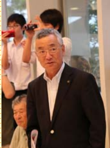
川越市長: 川合善明様