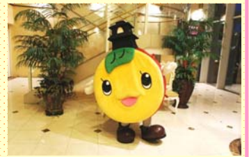
川越市イメージキャラクター 「ときも」