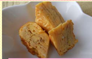
小江戸厚焼きたまご