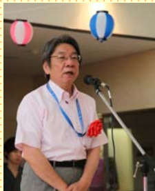
埼玉県議会議員 福永信之先生