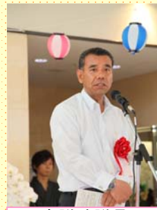
衆議院議員 神山佐市先生