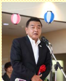
埼玉県議会議員 中野英幸先生