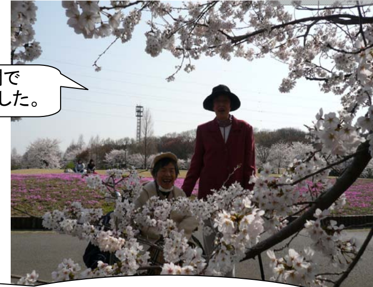
桜が満開で きれいでした。