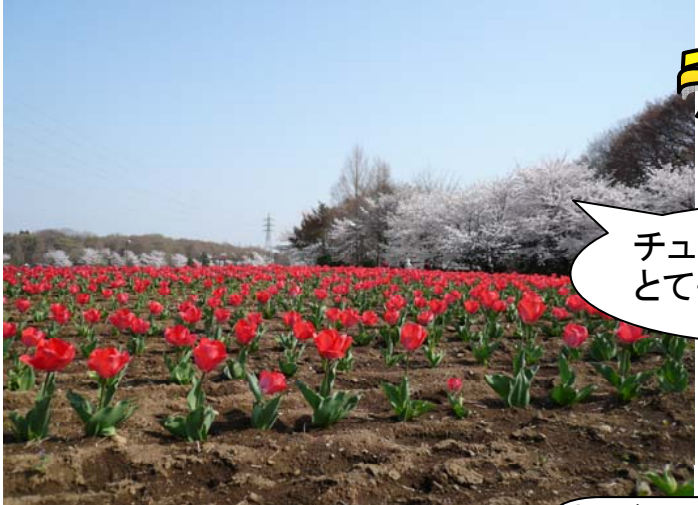
チューリップが とてもきれい！