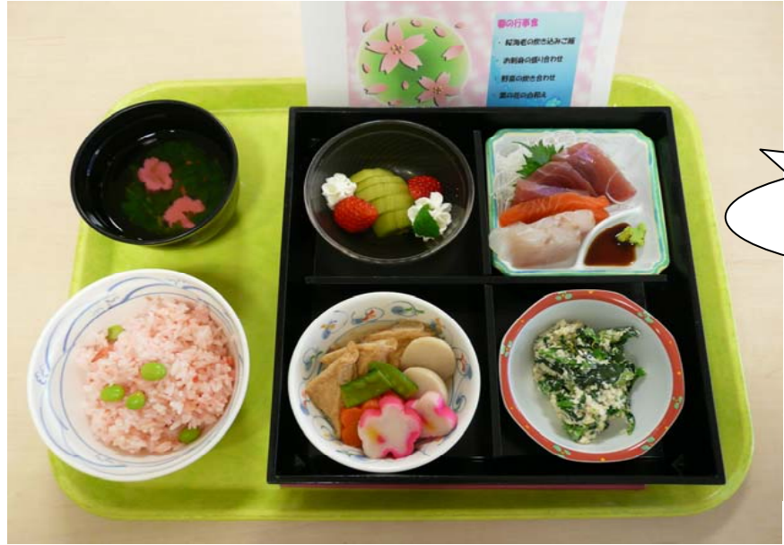
行事食の献立 "春"をイメージしています。