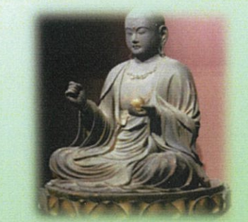
六波羅蜜寺の地藏菩薩像 (運慶作)

10年に1度位しか行くことはできませんが、古都、特に京都を歩くのが好きです。私は三千院の阿弥陀如来、妻は六波羅蜜寺の地藏菩薩像、娘は永観堂の見返り阿弥陀像が好きです。それぞれ御縁があって懐しく慕わしく感じるのだと思います。雪の三千院、桜の六波羅蜜寺、紅葉の永観堂も素敵です。奈良では道昭(興福寺)、鑑真(唐招提寺)、行基(東大寺、薬師寺)、京都では最澄(延暦寺)、空海(東寺)、法然(知恩院)、栄西(建仁寺)などの僧と弟子達が1000年近い時を掛けて数々の名刹を建て維持した結果、現在の古都の趣が作られました。アフガニスタンのバーミヤン渓谷にあった古代の巨大石仏2体を始めとして周囲の文化的景観と古代遺跡群は、数百年を掛けて作られたものですが、2001年3月にタリバンが破壊しました。京都も第2次世界大戦で焼け野原になる可能性がありました。米軍は奈良や京都の文化遺産を守るために空襲しなかったといわれていますが、実際には小倉(長崎)、広島、横浜、新潟、京都の5都市が原爆投下候補地に選ばれていました。原爆投下目標都市は原爆の効果を確認するため空爆対象から外していました。確かに米軍にも文化遺産を守るため古都には原爆投下や空爆をしないように意見した人はいましたが、少数派でその意見は通りませんでした。奈良は人口が少なく軍需工場もなかったため空爆されませんでした。戦争で古都が破壊されなかったのは単なる偶然だったのです。偶然とは言え奈良や京都が破壊を免れたため、古都の歴史を目の当たりにして現在観光を楽しむことができるのはこの上ない僥倖です。この文化遺産を大事に後世に伝えていきたいと思っています。