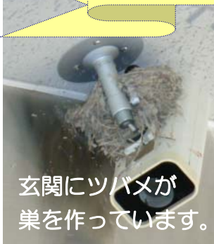
玄関にツバメが 巣を作っています。