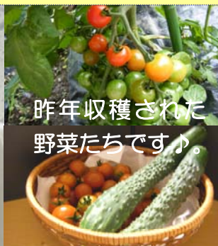
昨年収穫された 野菜たちです。