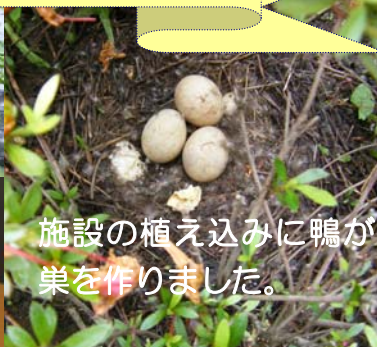
施設の植え込みに鴨が 巣を作りました。

7月に入り暑い日が続いております。寒い冬を乗り越えて、今年も施設周辺では色々な命が芽吹いています。トワームにも畑があることを皆様御存知でしょうか？ リハビリ室ベランダ南側とデイケアベランダ西側の一部を開墾して畑スペースを確保しています。主に夏野菜を中心に栽培しております。リハビリにいらっしゃる皆様の中には、すくすく育つ野菜の成長を楽しみにされている方も大勢いらっしゃいます。